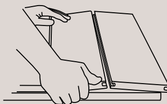
Abb. 2 Anheben der Dielen